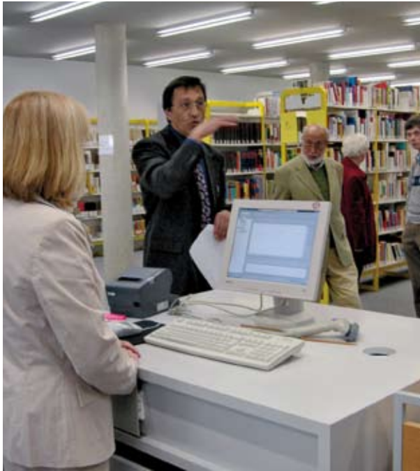
Die Bibliothek auf Augenhöhe mit modernsten Ansprüchen

Dem ewigen Heil dienen die „geistlichen Berufe und Ämter, das Pfarramt, Lehrer, Prediger, Leser, Caplan, Küster und Schulmeister“. Hier geht es darum, dass Menschen ihres Glaubens einsichtig und gewiss werden. Hier sind die Religionspädagogen zu nennen, die religiöse Bildung in Jugendarbeit, Schule und Gemeinde befördern. Auch hier gibt es Bedrohungen durch Traditionsabbrüche einerseits und Fundamentalismus andererseits. Religionspädagogisches Handeln begleitet und stärkt Kinder, Jugendliche und Erwachsene auf ihrem Weg.