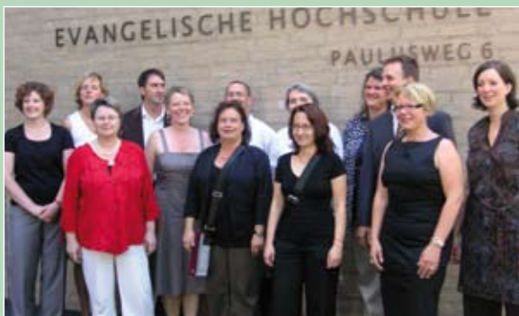
Am Ende: Der erste Jahrgang „Master Organisationsentwicklung“