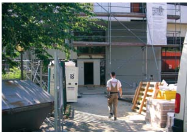
Wegzug: Der Sanierung Raum geschaffen