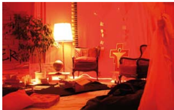
Gottesdienst intensiv: Meditative Lichtspiele inklusive