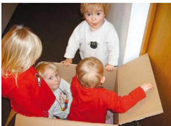
Auszug: Die Kleinkindergruppe packt das Wichtigste