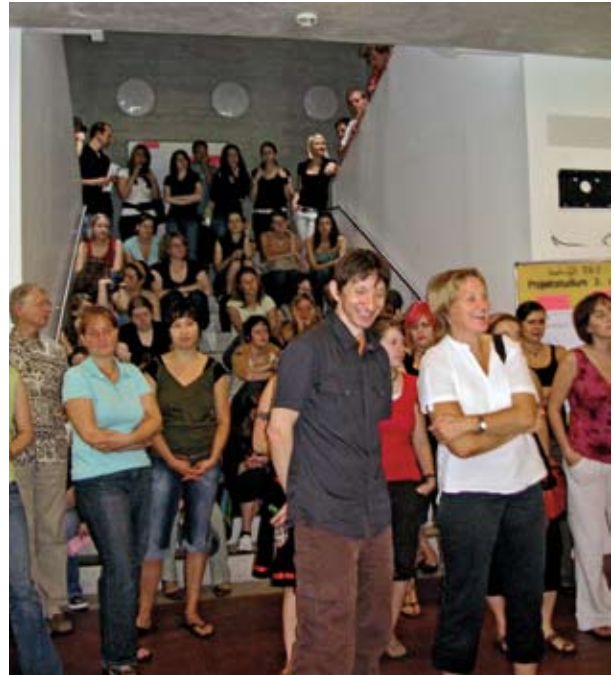
Stadionflair: Die Treppe wird zur Tribüne

Mit der Hochschule bildet die Evangelische Landeskirche in Württemberg nicht nur für Ihre eigenen Anliegen und Dienste aus sondern sie wirkt in die Gesellschaft hinein und sie wirkt für die Menschen, die in dieser Gesellschaft leben.