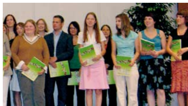
Strahlende Gesichter bei der Diplomübergabe