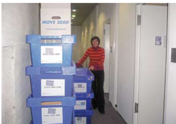
Umzug: Tagelang aus Kisten gelebt