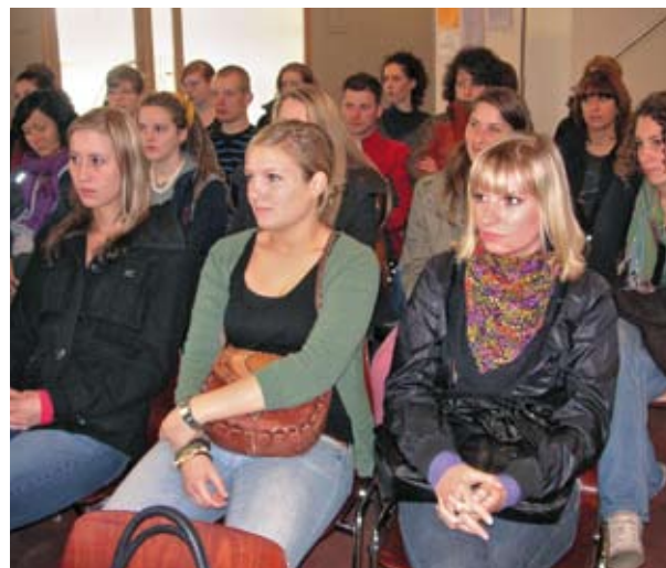
Alles Anfang: Ersteinschreibung und erste Einführungswoche im Neubau