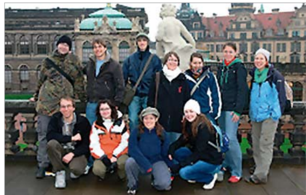
Erlebnis Elbflorenz: Dresden und Moritzburg hautnah für die Hochschulgemeinde