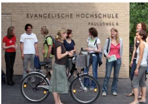
Einzug: Studierende stehen Schlange